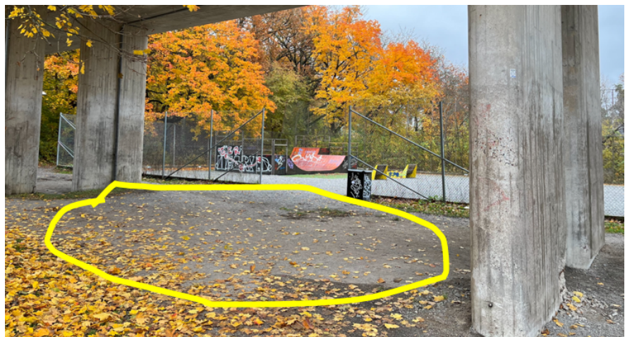
Skejtbanan flyttas från den inhägnade bollplanen till en plats under tunnelbanespåret (gulmarkerat i fotot).

Den förslagna platsen är idag redan en bollplan i grus. Efter platsbesök bedömer förvaltningen att planen kan omvandlas till en tennisplan. På bollplanen finns idag en skejtbana. Den planerar förvaltningen att istället placera utanför den inhägnade planen, under tunnelbanespåret.